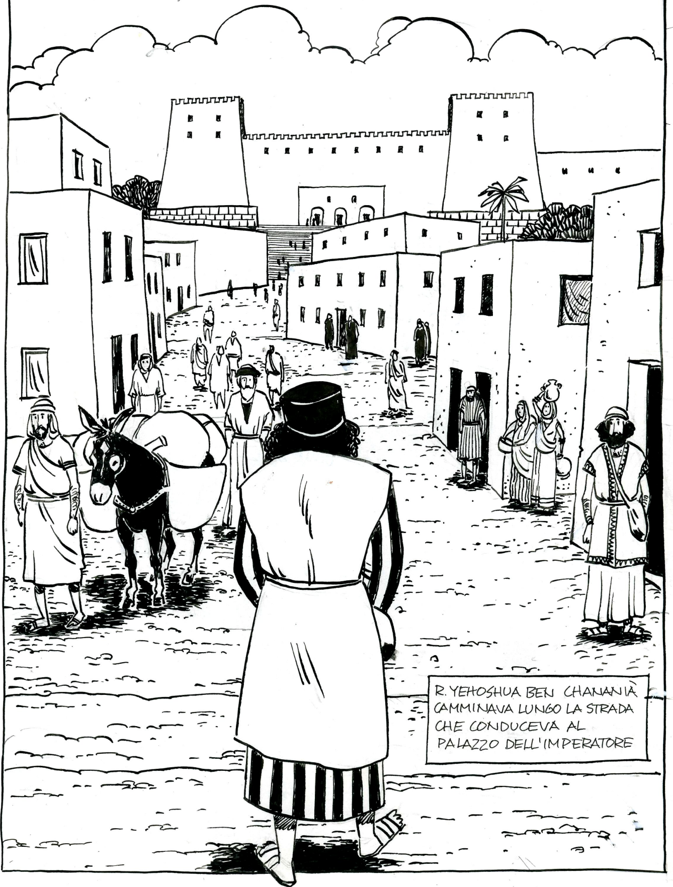
R. YEHOSHUA BEN CHANANIA CAMMINAVA LUNGO LA STRADA CHE CONDUCEVA AL PALAZZO DELL'IMPERATORE